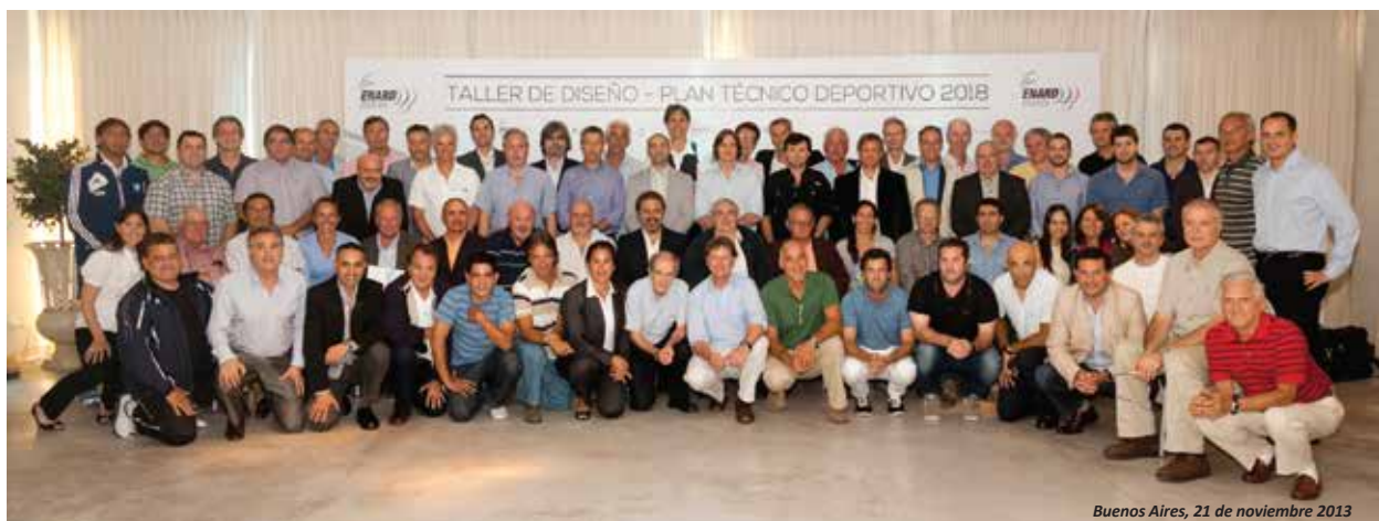
Buenos Aires, 21 de noviembre 2013

With this in mind, this programme will enable us to do something meaningful: “to create future” .